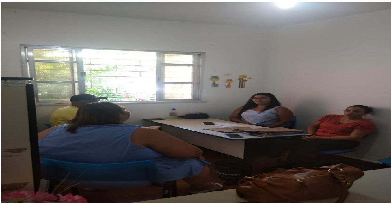
05/04/2024, Foi realizado um estudo de caso com o Conselho Tutelar da sede para tratar de alguns casos relacionados A crianças e adolescentes.