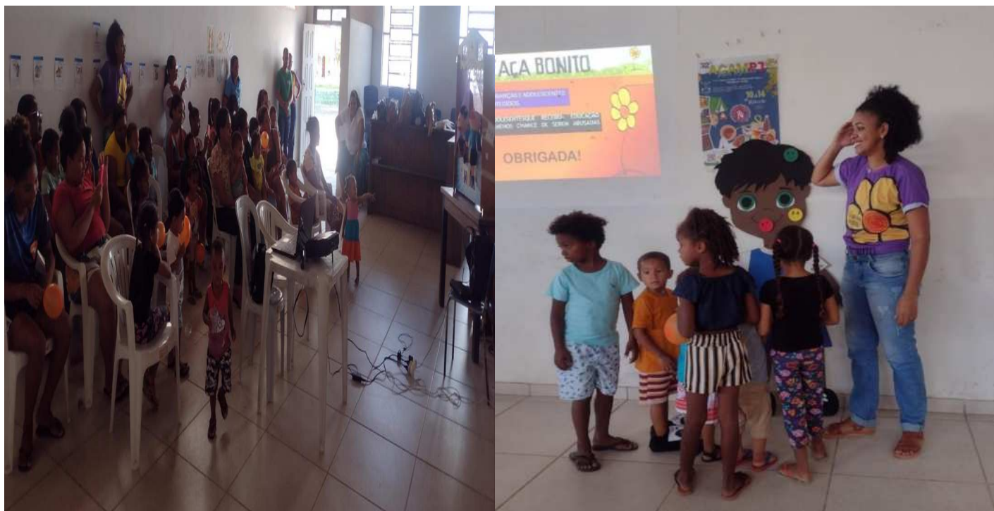
No dia 29/05/2024 a ação da Campanha Maio Laranja, aconteceu em Barrolândia, distrito de Belmonte/BA, às famílias acompanhadas do PIS.