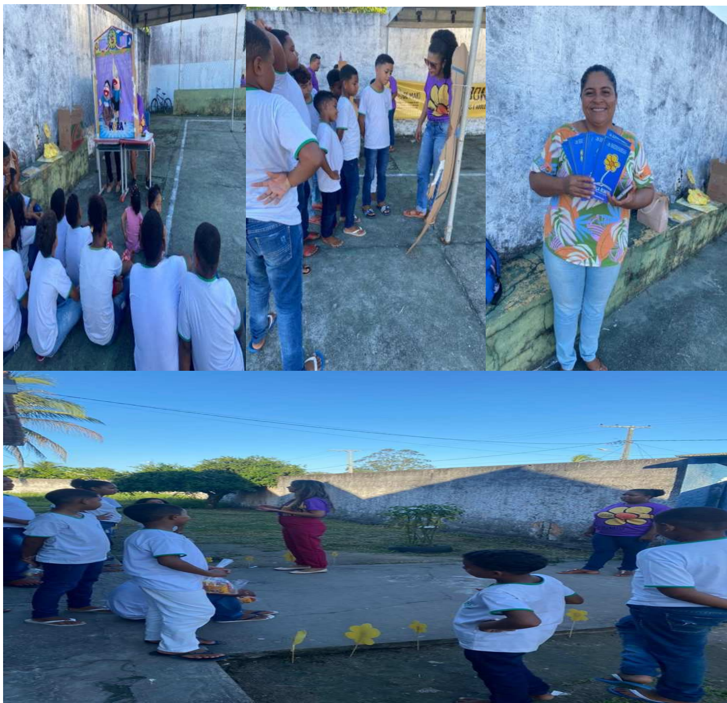
Na parte da tarde, ainda do dia 14/05/2024, a ação aconteceu no distrito de Boca do Córrego, na Escola Dr. Menandro Menahim.