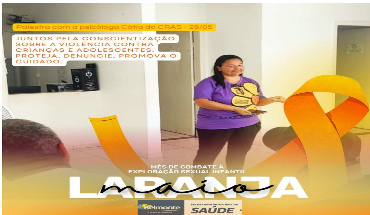
No dia 29/05/2024, em parceria com o CRAS, a técnica de referência palestrou na recepção do posto de saúde do Bom Jardim sobre a prevenção ao abuso sexual infantil e de adolescente