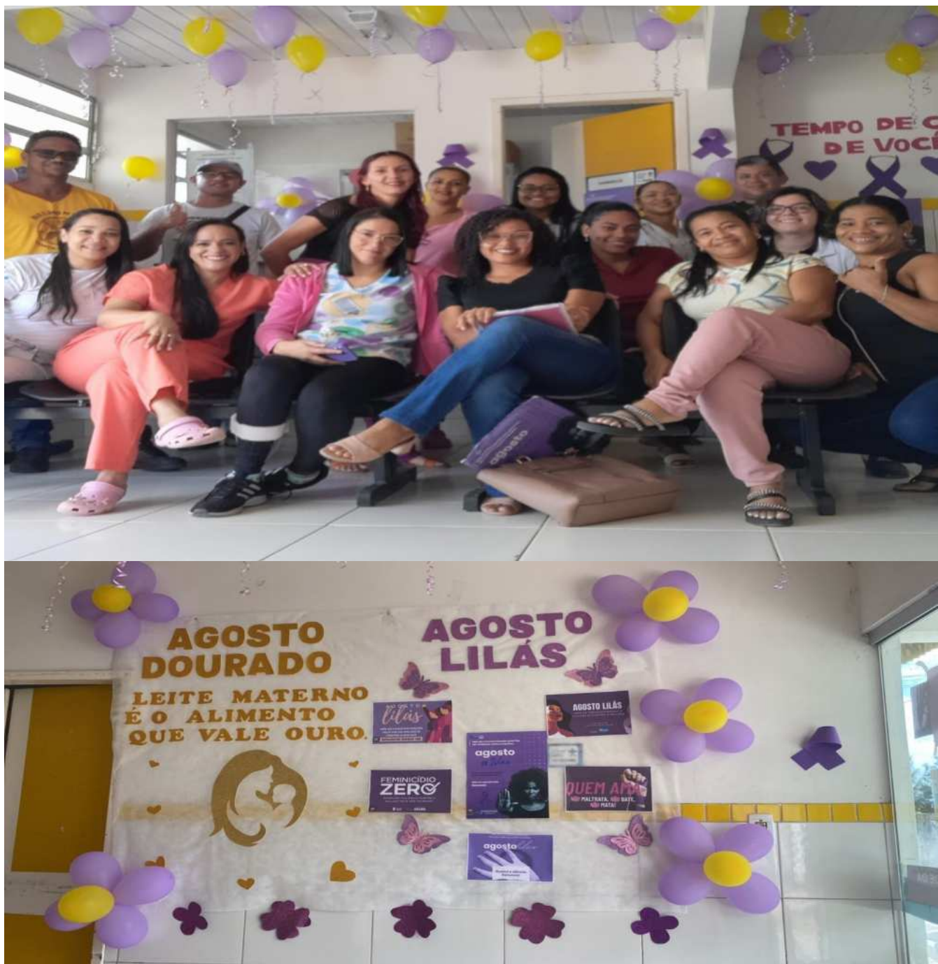
No dia 30/08/2024, aconteceu um evento em Barrolândia, no PSF III, a ação do Agosto lilás e Agosto Dourado.